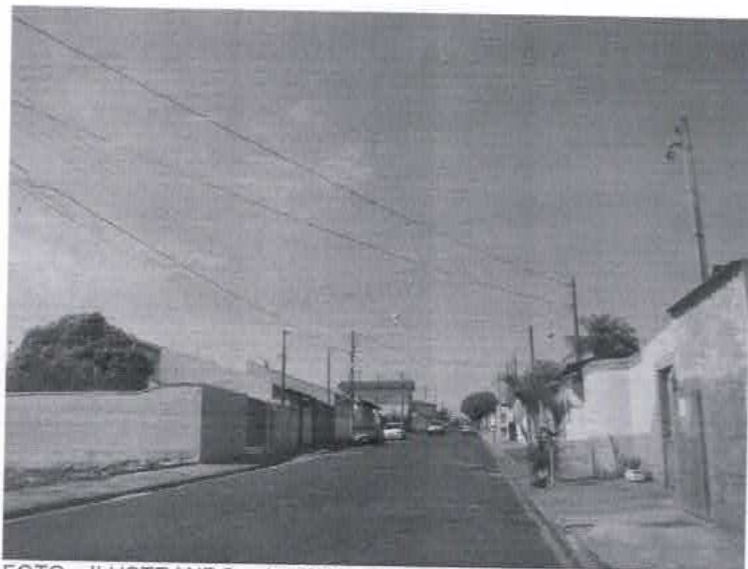
FOTO ILUSTRANDO A RUA VERGILIO ENEI CARENTE DE ARBORIZAÇÃO.

CNPJ 46.200.853/0001-78, Fone: (14)3298-9800, Fax: (14)3298-9832