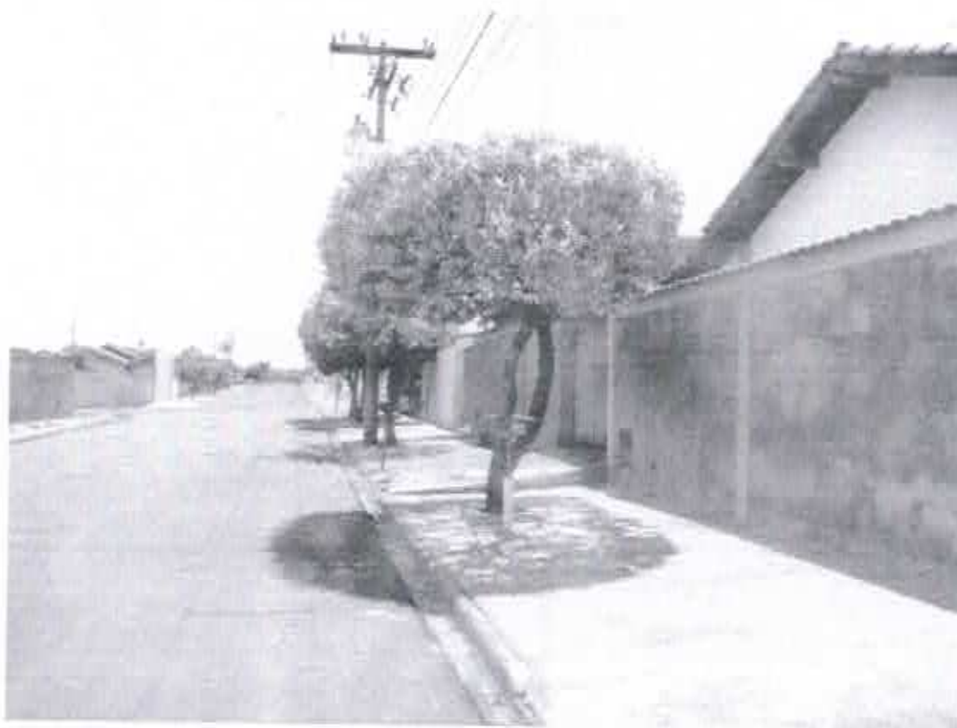
FOTO DEMONSTRANDO BAIXA VARIABILIDADE DE ESPÉCIES

Rua Nove de Julho, 15-20, Centro, CEP 17290-000, Macatuba, SP. CNPJ 46.200.853/0001-78, Fone: (14)3298-9800, Fax: (14)3298-9832