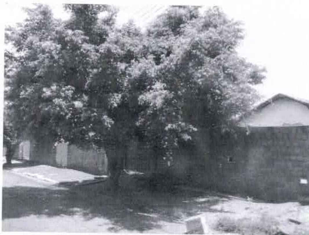
FOTO DEMONSTRANDO ÁRVORE COM FORTE ENRAIZAMENTO