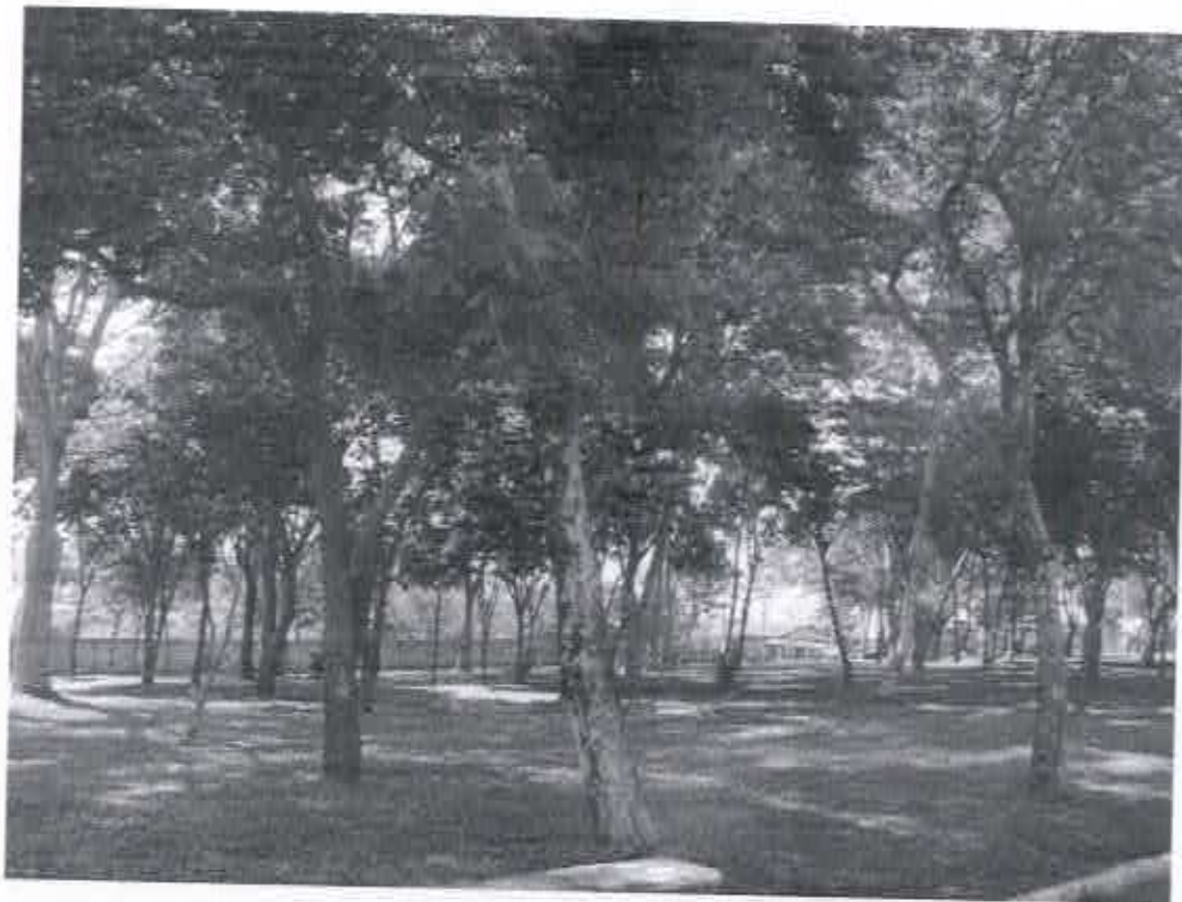
PRAÇA ARBORIZADA NO JD. CAPRI

Rua Nove de Julho, 15-20. Centro, CEP 17290-000, Macatuba, SP. CNPJ 46.200.853/0001-76. Fone: (14)3298-9800, Fax: (14)3298-9832