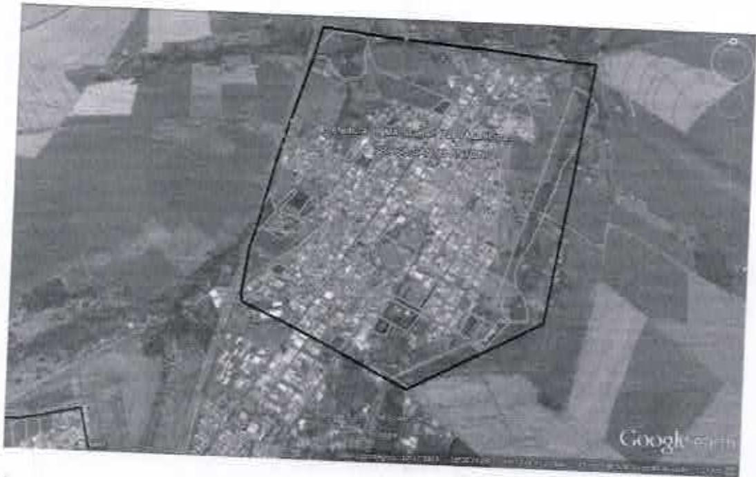
SETOR 2: rodoviária para cima

Rua Nove de Julho, 15-20, Centro, CEP 17280-000, Macatuba, SP. CNPJ 46.200.853/0001-78, Fone: (14)3298-9800, Fax: (14)3298-9832