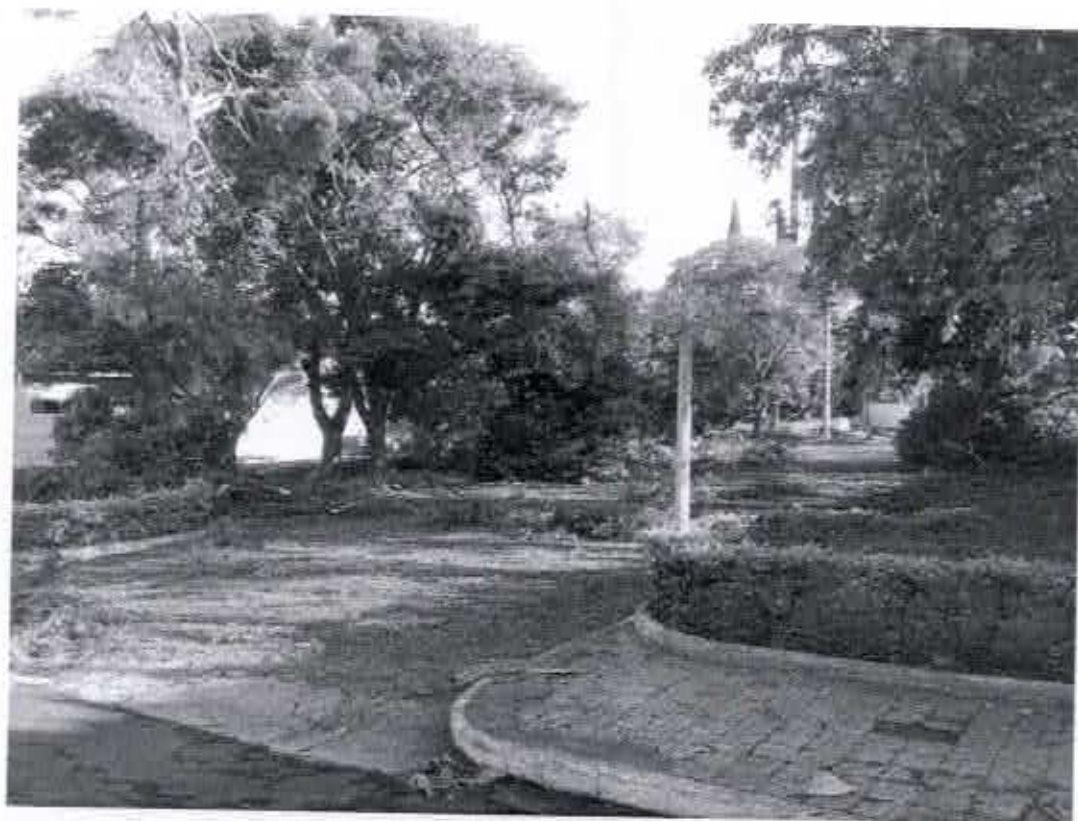
ESTACIONAMENTO DO ALMOXARIFADO FEVEREIRO DE 2019.

Rua Nova de Julho, 15-20, Centro, CEP 17290-000, Macatuba, SP. CNPJ 46.200.853/0001-78, Fone: (14)3298-9800, Fax: (14)3296-9832