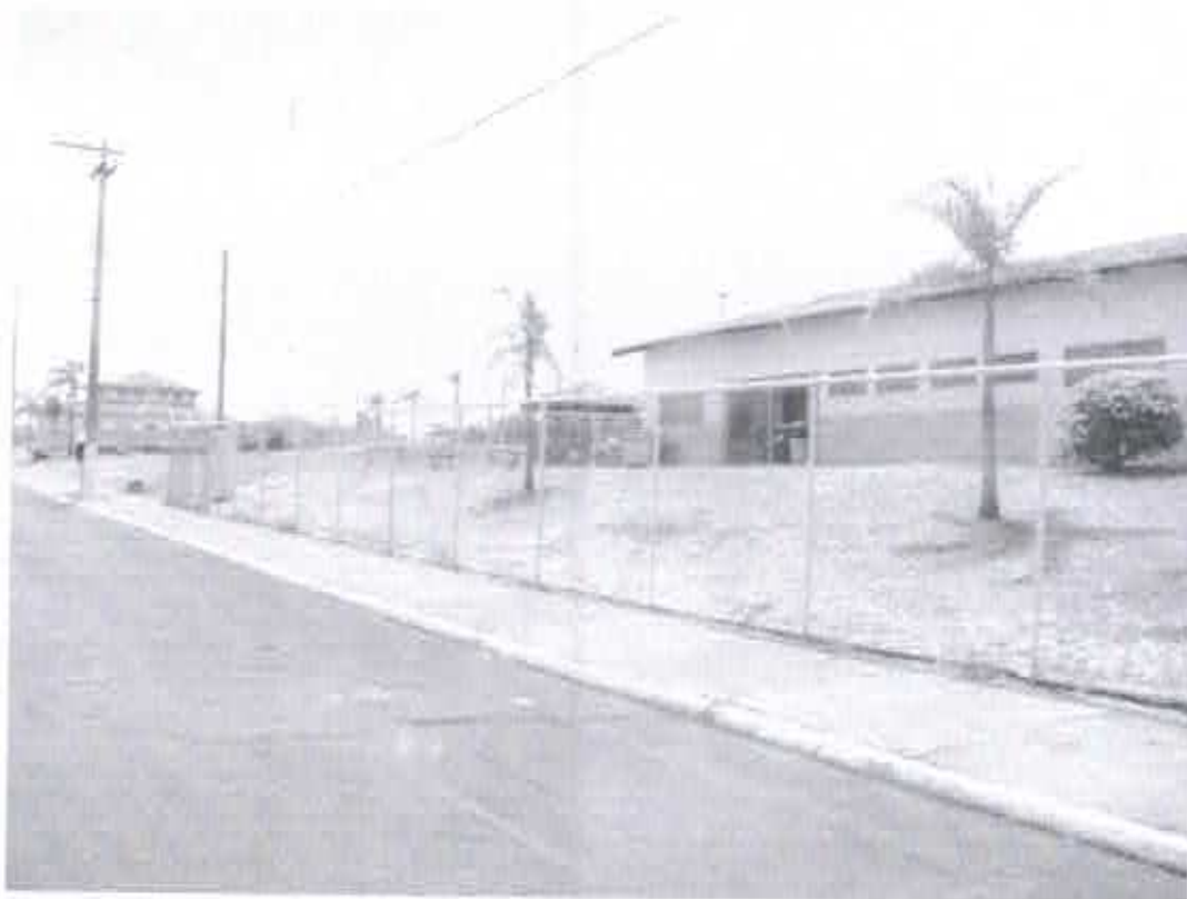
FOTO MOSTRANDO ÁREA DO SETOR CARENTE DE ÁRVORE

Rua Nove de Julho, 15-20, Centro, CEP 17290-000, Macatuba, SP. CNPJ 46.200.853/0001-78, Fone: (14)3298-9800, Fax: (14)3298-9832