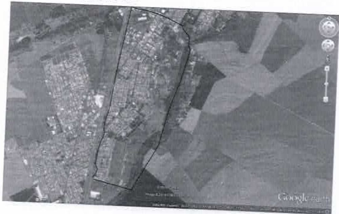
SETOR 3: Altos da cidade.