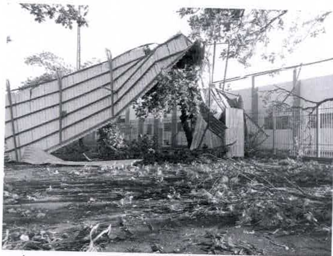
ESTÁDIO AMADEU ARTIOLI

Rua Nove de Julho, 15-20, Centro, CEP 17290-000, Macatuba, SP, CNPJ 46.200.853/0001-78, Fone: (14)3298-9800, Fax: (14)3298-9832