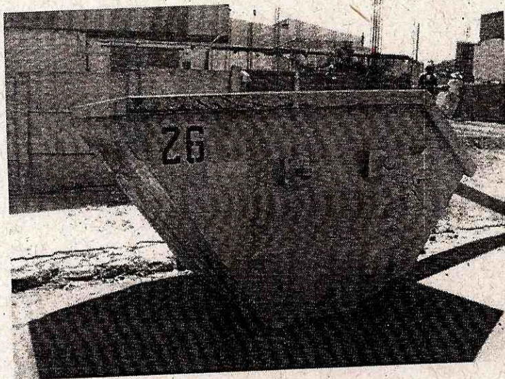
Figura 3 – Caçamba de entulho disponibilizada pela Prefeitura.

Com relação aos resíduos volumosos, o Município ainda não possui um local para destinação dos mesmos. Atualmente, estes resíduos são dispostos em áreas degradadas por processo de erosão linear.