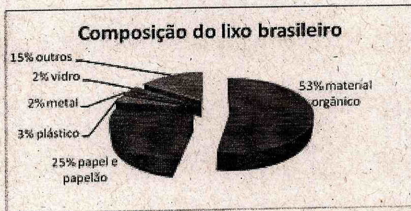
Figura 1 - Caracterização dos resíduos sólidos de municípios da região de Bocaina.

Com os percentuais de cada tipo de material presente no lixo gerado pela população, se pode calcular os volumes gerados e determinar o horizonte de atendimento.